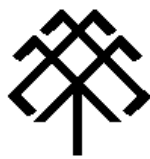
Рис.7. Цветок папоротника (Огнецвет)