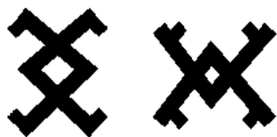
Рис.9. Союз двух начал

Конечно, в рамках одной статьи не возможно отобразить всю многообразную картину семантики этнических славянских символов. Однако понимание даже основ «языка» этнохудожественной символики позволяет гораздо шире интерпретировать её ценностное содержание. Обладая уникальной спецификой, в которой категория «смысла» доминирует над категорией «красоты», этнохудожественная культура подразумевает и особый подход к её толкованию.