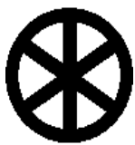
Рис.2 Громовой знак

крестом символически многократно зашифровывает пожелание блага, даруемого солнцем.